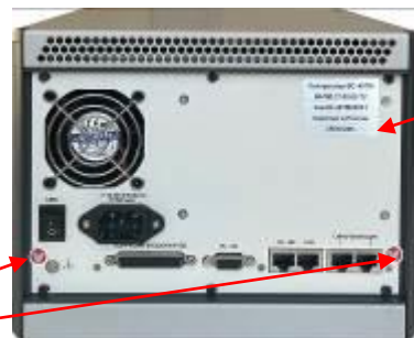
Рисунок 4 – модификация BC-407M4, вид сзади.

Место для нанесения знака утверждения типа